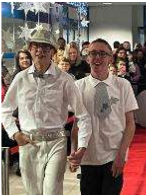
Motýlek módní přehlídka v rámci motýlek v oblacích