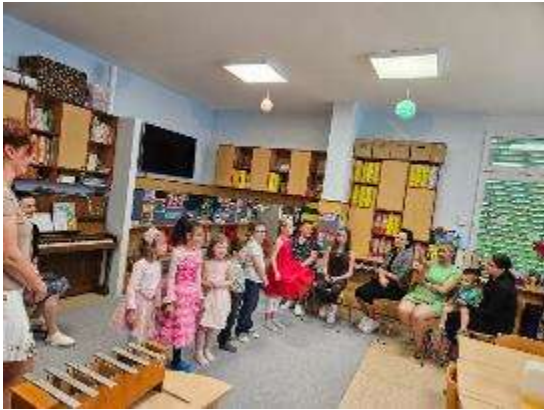
Den matek 2024