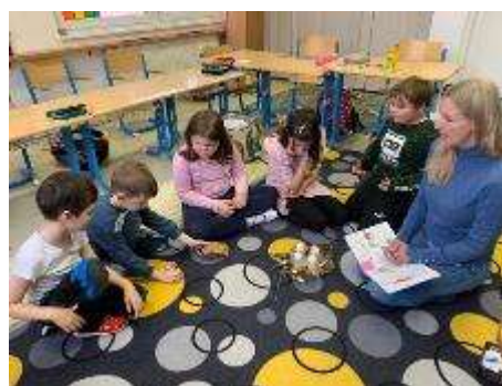
ŠVP ZV: „Motýlek nás učí“, 79-01-C/01 Základní škola