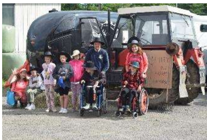
Zdroj: Základní škola a Mateřská škola Motýlek, Kopřivnice (hry bez hranic: koně)