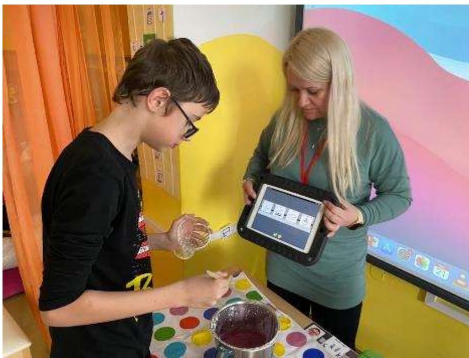
(vaření v Termomixu, instruovaný postup pomocí VOKS v tabletu)

na wifi internet. Kabinety pro učitele nemáme. Vedoucí školní jídelny má svůj počítač také připojen na internet a centrální tiskárnu školy. Škola nakoupila 13 notebooků a 3 tablety z účelových finančních prostředků MŠMT, které slouží k výuce distančního vzdělávání v omezeném režimu školy. Také z těchto financí byly zakoupeny sluchátka a webové kamery. Notebooky slouží k výpůjčce pro zákonné zástupce, kteří nemají možnost vlastního nákupu a splňovat tak podmínky povinného vzdělávání. Škola prochází modernizací a přístavbou budovy a speciálních místností, které škole dlouhodobě chybí. Jedna z těchto místností bude zároveň sloužit i jako počítačová učebna.