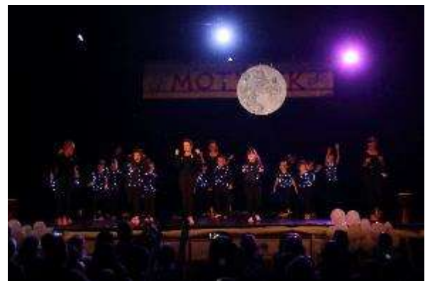
Motýlek s v oblacích