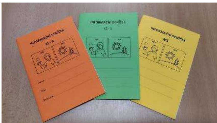
Zdroj: Základní škola a Mateřská škola Motýlek, Kopřivnice (komunikační deníčky)

Hospitace je klíčová pro zajištění kvalitní a individuálně přizpůsobené výuky, která podporuje maximální rozvoj každého žáka. Vedení školy Motýlek aktivně řídí, pravidelně monitoruje a vyhodnocuje práci školy a přijímá účinná opatření. Škola vypracovává vyhodnocení hospitací za uplynulý rok. Získané poznatky využíváme při tvorbě výroční zprávy a vlastního hodnocení školy. Vedení školy vyhodnocuje rizikové jevy a stanovujeme další úkoly pro příští rok.