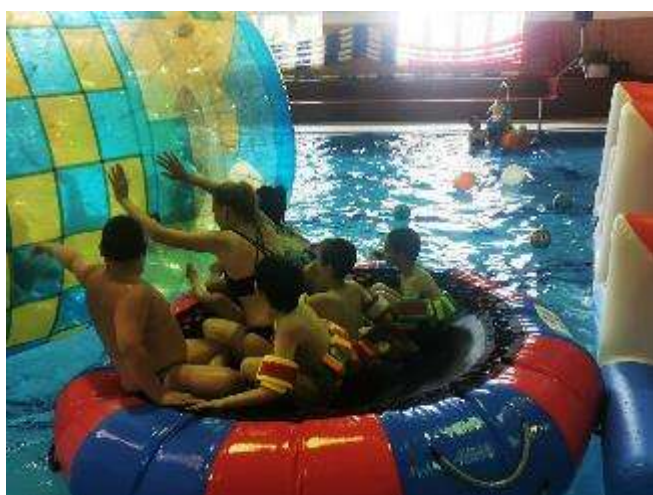
Zdroj: Základní škola a Mateřská škola Motýlek, Koprivnice

Zkvalitnění materiálně technického vybavení – zrealizované akce: V březnu 2023 byla zahájena modernizace přístavby naší školy, která nám pomůže vyřešit výše uvedené problémy a v květnu 2023, byla modernizace školy dokončena.