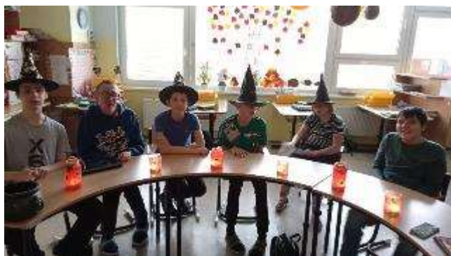
ŠVP ZŠ: „Motýlek a já“ - II., 79-01-B/01 Základní škola speciální

Ve vyučovacím procesu jsou využívány odborné pracovny logopedie, keramická dílna, tělocvična, chodba, smyslová místnost, jídelna, zahrada. Učební pomůcky, pracovní listy a další vzdělávací pomůcky vlastní výroby k vzdělávacímu programu ŠVP ZŠ „Motýlek a já - I“, ŠVP ZŠ „Motýlek a já - II“. Jsou využívány PC, výukové programy, audiotechnika, tablety, interaktivní tabule a moderní technologie. Všechny pomůcky jsou přístupné žákům s asistencí a pod dohledem. Žáci se podílí na výzdobě interiéru budovy (tematická výzdoba).